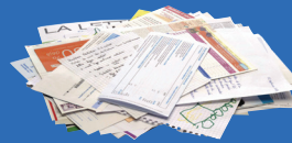
Courriers, enveloppes, livres

TOUS LES PAPIERS SE TRIENT ET SE RECYCLENT