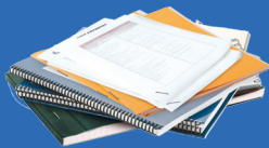
Cahiers, blocs-notes, impression