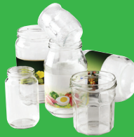
Pots et bocaux