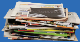
Journaux, catalogues, prospectus