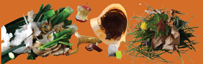
Déchets de cuisine et de jardin